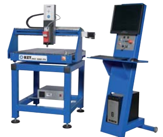
BZT PFE 500 mit Steuerungspult BZT PFE 500 with controlling device