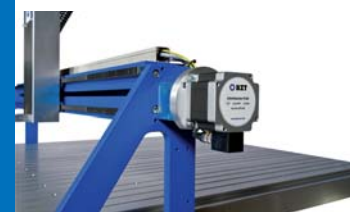
Seitenteil BZT PFE Side-part BZT PFE