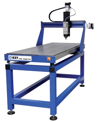
BZT PFE 1500, Portalerhöhung Z 250 mm BZT PFE 1500, Portal heightening Z 250 mm