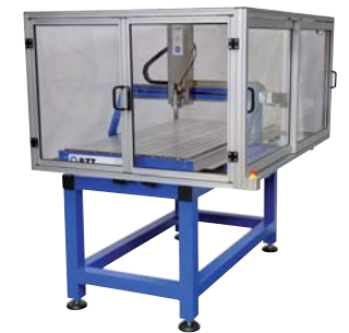
BZT PFE 1500 mit Einhausung BZT PFE 1500 with Housing